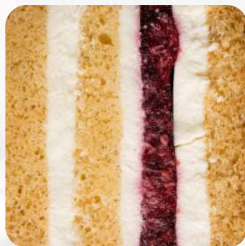
Ванильный бисквит с малиновой начинкой и крем - чизом