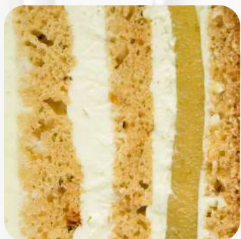
Фисташковый бисквит с лаймовой начинкой и мятным кремом

Мы с радостью подберём гармоничные сочетания для вашего торта