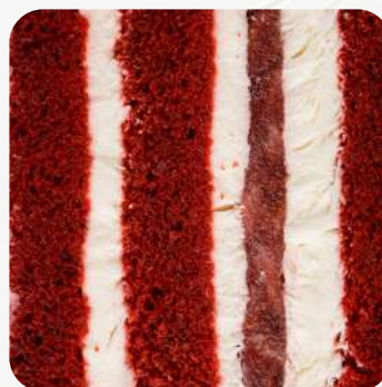
Красный бархат с клубничной начинкой и крем - чизом