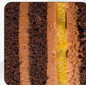
Шоколадный бисквит с апельсиновой начинкой и шоколадным кремом